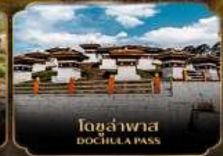
โดชล่าพาส DOCHULA PASS