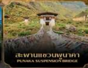
สะพานแขวนพุนาคา PUNAKA SUSPENSION BRIDGE