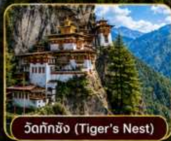
วัดทักซิง (Tiger's Nest)