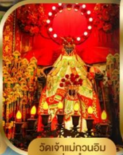
วัดเจ้าแม่กวนอิม ฮ่องซา