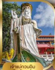
เจ้าแม่กวนอิม ริพลัสเบย์