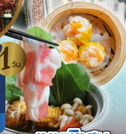
เจ้าแม่กวนอิม ริพลัสเบย์