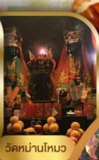
วัดบ้านใหม่