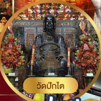
วัดปักโต