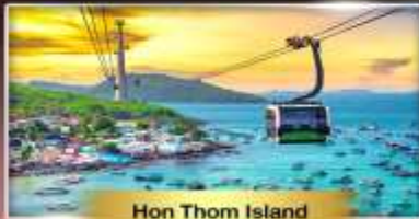
Hon Thom Island