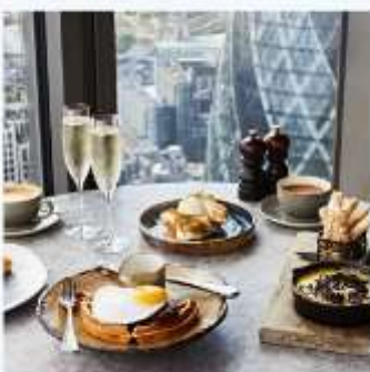
DUCK AND WAFFLE