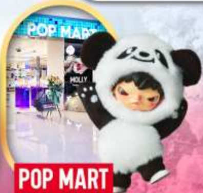
ช้อปปิ้งร้าน Pop Mart