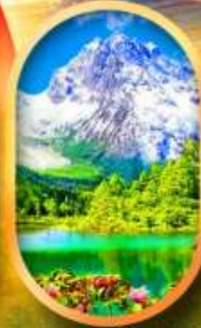
อุทยานปี้ฝิงโกว