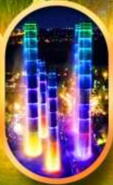
SKP Global Center