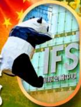
IFS หมีแพนด้าปิ่นตัก