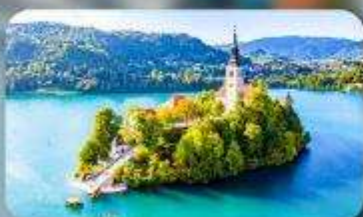
โบสถ์พระแม่มาเรียแห่งเบลค