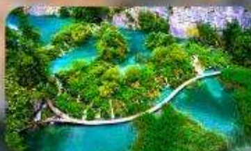
อุทยานแห่งชาติพลิตวิเซ่