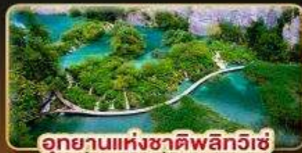
อุทยานแห่งชาติพลิตวิเช่