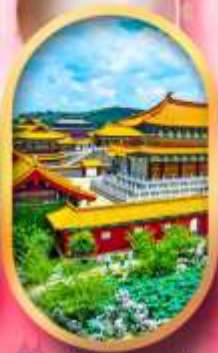
เมืองจำลองสามก๊ก