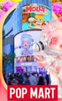
ช้อปปิ้งถนนหนางจิง