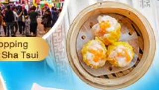
Shopping Taim Sha Tsui