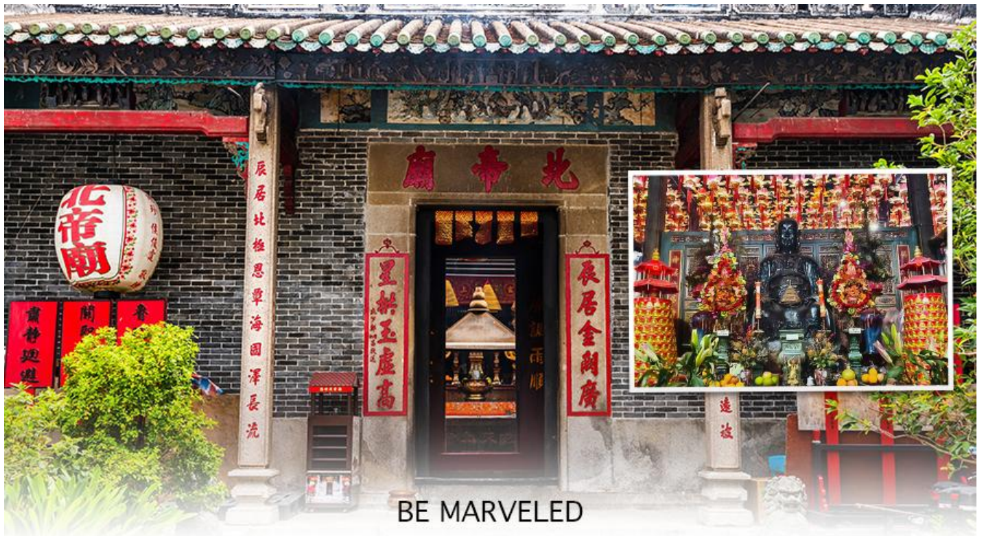
BE MARVELED วัดปักไต้

แห่งท้องทะเล ในลัทธิเต๋า และชาวฮ่องกงเชื่อกันว่าผู้ใดที่เกิดปีชง หากมาทำการแก้ดวงชะตาแก้ชงประจำปีที่วัดนี้ จะทำให้ร้าย กลายเป็นดีได้ และที่วัดยังมี “เทพเจ้าเปลี่ยนใจ” ที่นิยมมาขอพรให้เรื่องที่ไม่ดี กลายเป็นเรื่องดีหรือ คนที่เป็นศัตรูของเราเปลี่ยนใจมาเป็นมิตร เป็นที่นิยมอย่างมากของชาวท้องถิ่นฮ่องกงมากราบไหว้ขอพรกันที่วัดนี้