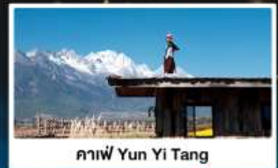
คาเฟ่ Yun Yi Tang