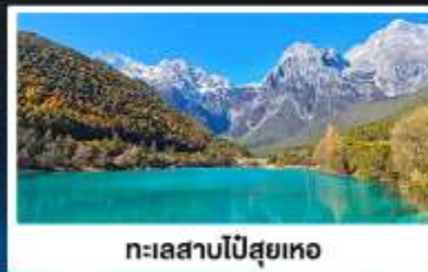
ทะเลสาบโป๋สยห่อ