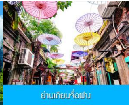
ย่านเกียบจื่อฝาง