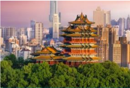
นครนานกิง