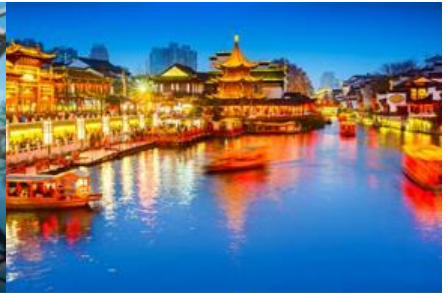
ย่านฟูจื่อเมี่ยว