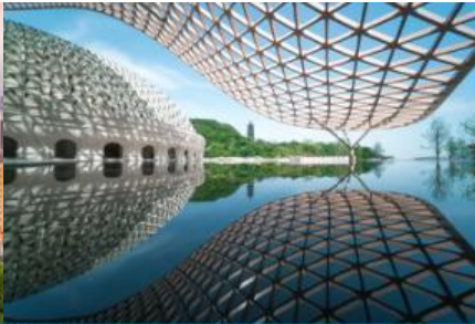
อุทยานกุ่มกี่ยวหนิวโล่วซาน