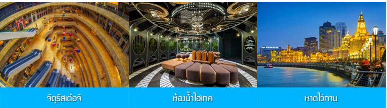
จัตุรัสเต๋อจี

พักที่ โรงแรม Holiday Inn Express Dongshan Hotel 4* หรือเทียบเท่าในนครหนานจิง