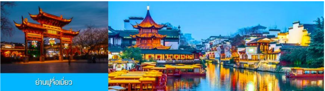
ย่านฟูจื่อเมี่ยว