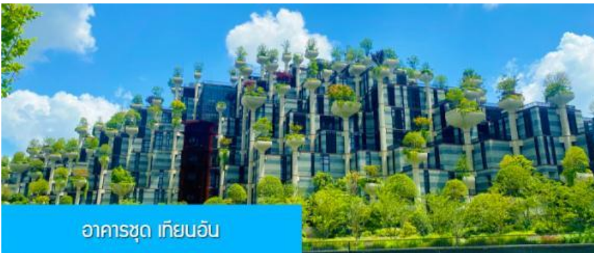
อาคารชุด เทียนอัน

เที่ยง รับประทานอาหารกลางวัน ณ ภัตตาคาร (6)