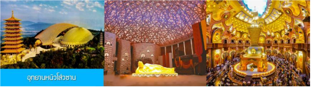
อุทยานหนิวสั่วซาน