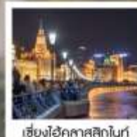
เชียงใหม่คาสสิกไนท์