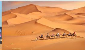
ทะเลทรายเสี่ยงชวาน