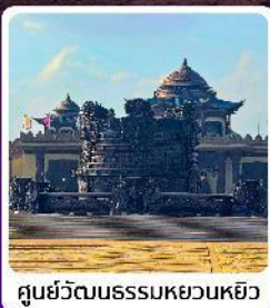
ศูนย์วัฒนธรรมหยวนหยิว