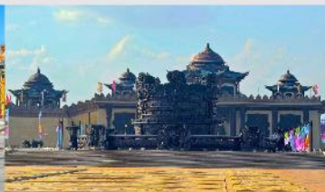
ศูนย์วัฒนธรรมหยวนหยิว