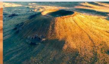
ภูเขาไฟอูลันฮาตา

*ทางบริษัทฯ ขอสงวนสิทธิ์ในการสลับโปรแกรมทัวร์ตามความเหมาะสมขึ้นอยู่กับสถานการณ์หน้างาน โดยคำนึงถึงผลประโยชน์ของลูกค้าเป็นสำคัญ