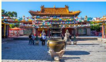
วัดต้าเจา