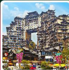
ตึกหัตถกรรม 72