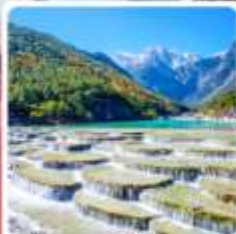
ทะเลสาบโป๋สุ่ยเหอ