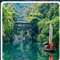
หมู่บ้านชาวน้ำเซียงหยาง