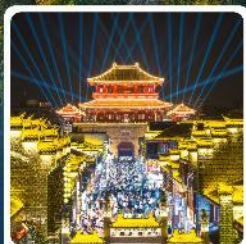
เมืองโบราณเซียงหยาง