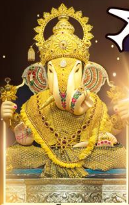
องค์ดีกชู่พิเศษ