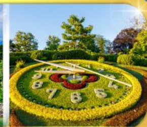
นาฬิกาดอกไม้เมืองเจนีวา