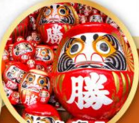
วัดคัตสึโองิ (วัดदारุมะ)

ชมความงามของกำแพงหิมะ เส้นทางสายอัลไพน์ ทากายามา (JAPAN ALPS SNOW WALL)