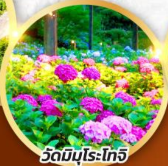
วัดมิมุโระโทจิ