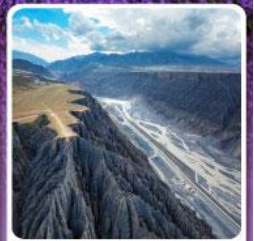
แกรนด์แคนยอนคู่ซานจื่อ