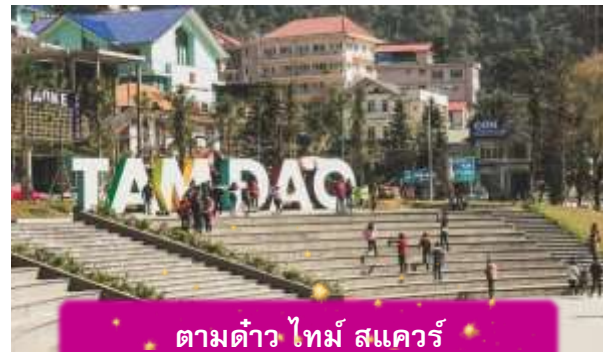
ตามด้าว ไทม์ สแควร์

อิสระท่าน ตลาดกลางคืนตามด้าว เมื่อแสงแดดลับขอบเขา เมืองบนดอยแห่งนี้จะค่อย ๆ เปลี่ยนบรรยากาศเป็นความคึกคักแบบเรียบง่าย ตลาดกลางคืนตามด้าวเต็มไปด้วยของกินพื้นเมือง กลิ่นหอมของหมูย่าง ไชนักรักษา และข้าวโพดย่างลอยคลุ้งไปทั่ว นักท่องเที่ยวเดินจับจ่าย พุดคุย และหยุดถ่ายรูปตามแสงไฟที่ประดับอยู่ทั่วตลาด บรรยากาศเป็นกันเองและอบอุ่น เหมาะกับการเดินเล่น ปิดท้ายวันด้วยความสุขเล็กๆ ๆ ที่สัมผัสได้