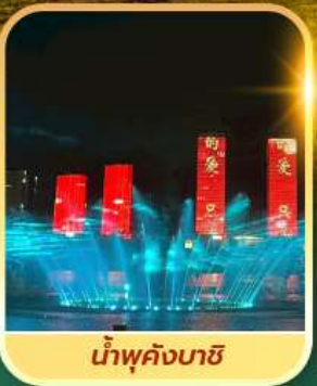
น้ำพุคังบาซี