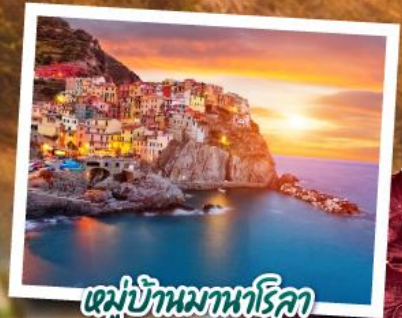
หมู่บ้านมานาโรคา