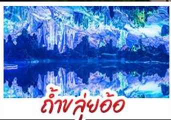
ถ้ำขลุ่ยอ้อ