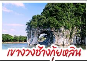
เขางวงช้างกุ้ยหลิน

ห้องเรือแม่น้ำลี่เจียง สวนสตรอว์เบอร์รี่ ทัศนียภาพคดัดยง นั่งบอลูนชมวิว 360 องศา ทางวงช้างกุ้ยหลิน กำฝู้อ้อ ฟ้ารุ้อี้ เมืองกุ้ยหลิน รถไฟความเร็วสูง พักรองแรมระดับ 5 ดาว เมบูอาหารพิศข POP MART