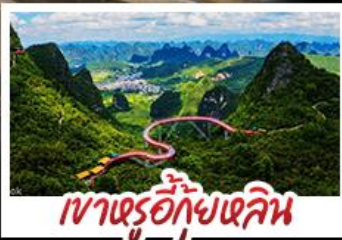
เขาตรู้อี้กุ้ยหลิน