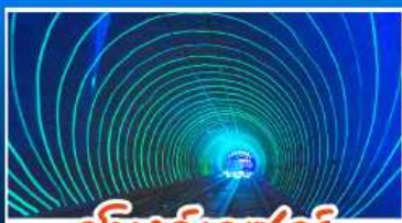
อูมิงค์เลเซอร์