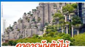
อาคารพันต้นไม้อุทยาน 1000 TREES