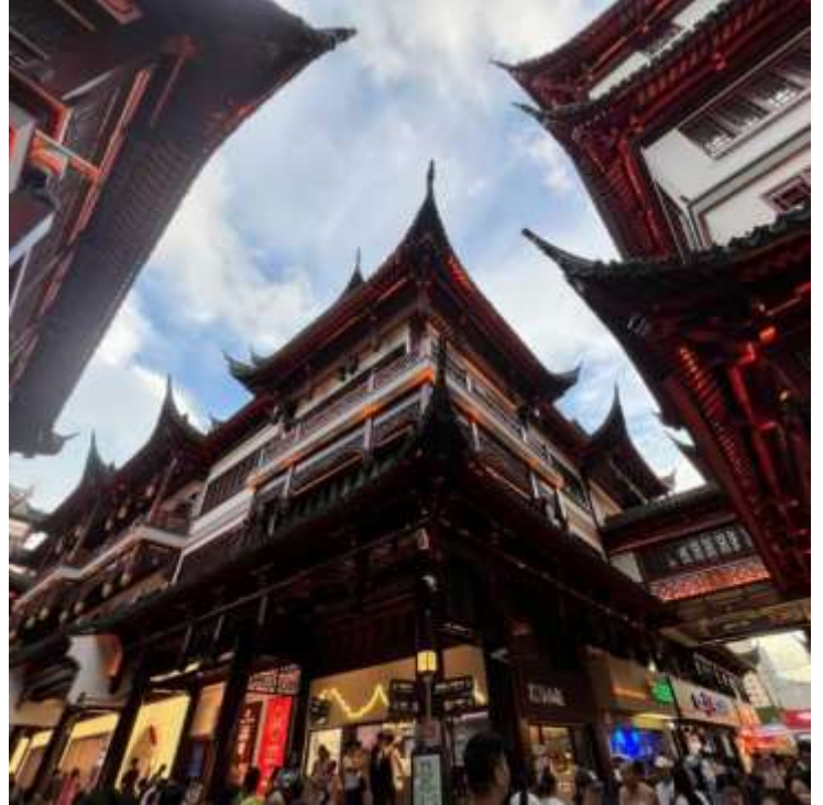
กลางวัน รับประทานอาหารกลางวัน ณ ภัตตาคาร (มือที่ 2)