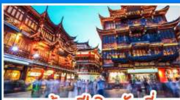
ตลาคดร้อยปีหญิงหวังเมี่ยว