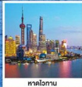
หาดโวกาน