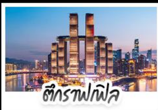
ตึกรางฟลิค