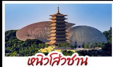
เจิวส่วชาน