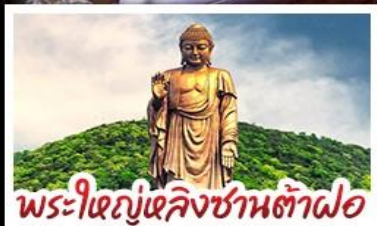
พระใหญ่หลังสวนต้าฝอ