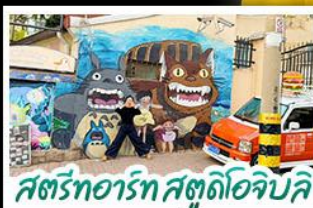
สตรีทอาร์ต สตูดิโอจิบลิ