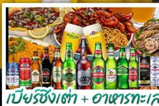
เบียร์ชิงเต่า + อาหารทะเล