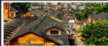
เมืองโบราณสี่ปาที้