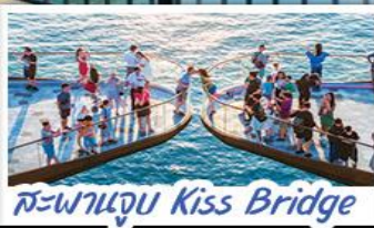
สะพานจูบ Kiss Bridge