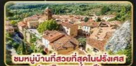
ชมหมู่บ้านที่สวยงามที่สุดในฝรั่งเศส (มูสติเยแซงก์มารี)