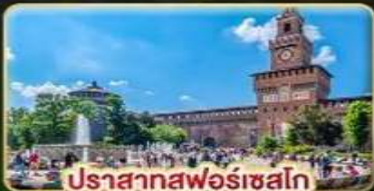
ปราสาทพอร์เชลโก

เดินทาง : 28 พ.ค. - 06 มิ.ย. | 05-14 ส.ค. 15-24 ต.ค. 69