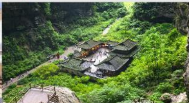
อุทยานแห่งชาติบ่อหลุมฟ้า

*ทางบริษัทฯ ขอสงวนสิทธิ์ในการสลับโปรแกรมทัวร์ตามความเหมาะสมขึ้นอยู่กับสถานการณ์หน้างาน โดยคำนึงถึงผลประโยชน์ของลูกค้าเป็นสำคัญ