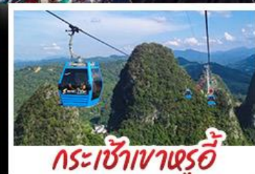
กระเช้าเขารู้อยี่