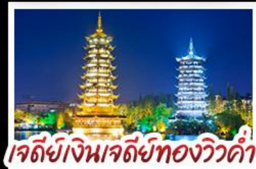
เจดีย์เงินเจดีย์ทองวิวคำ

เมนูพิเศษ บุฟเฟ่ต์ชาบูซีฟู้ด ปลาอบเบียร์ เผือกคริสตัล สุกี้หัด