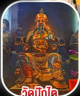
วัดปึกโต