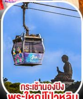
กระเช้าเองปีง พระใหญ่ไผ่หลิน