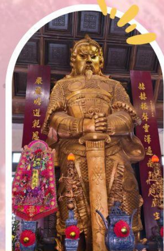
วัดแซกง ขอพรโชคลาก การเงิน และธุรกิจ