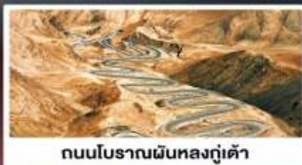
ถนนโบราณผืนหลงกู่เต้า