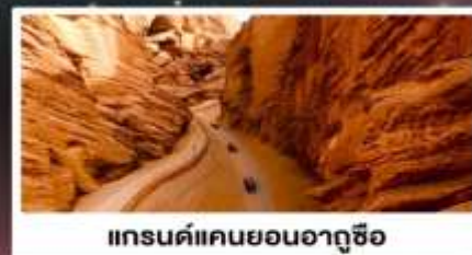
แกรนด์แคนยอนอาถูซื่อ