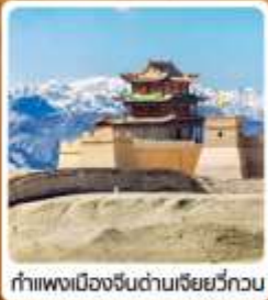
กำแพงเมืองจีนด่านเจี๋ยวี่กวน