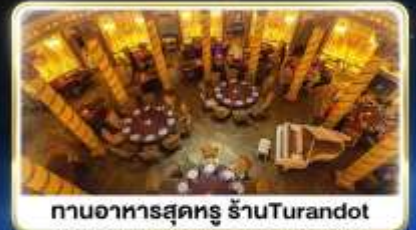
ทานอาหารสุดหรู ร้านTurandot