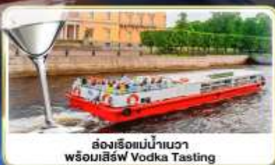
ล่องเรือแม่น้ำวอวา พร้อมเสิร์ฟ Vodka Tasting

เดินทาง : 14-21 มิ.ย.69 / 28 มิ.ย.-05 ก.ค.69 / 24-31 ก.ค.69