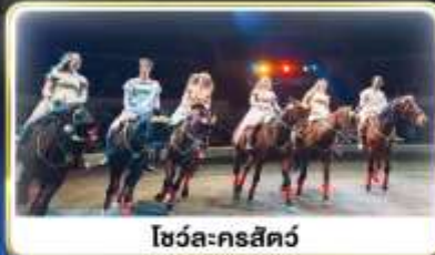
โชว์ละครสัตว์