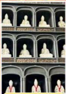
วัดไดชิซังเซโด้จิ