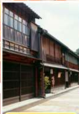
ย่านอิงาชิซายะ