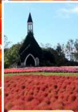
สวนบกกะโนะซาโตะ