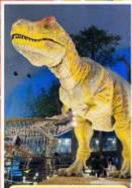
พิพิธภัณฑ์ไดโนเสาร์