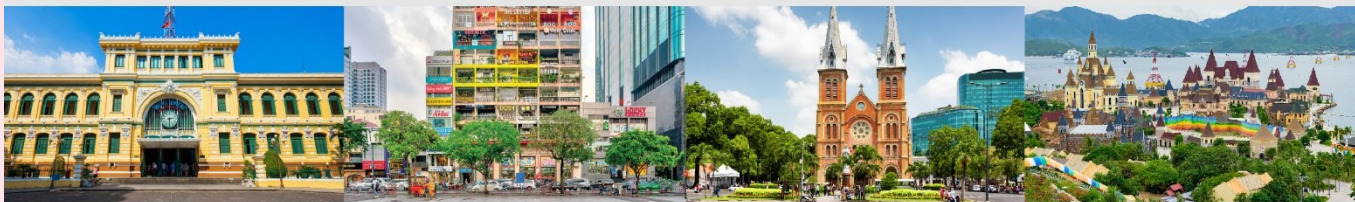
ไพรบ์ย์กลางโฮจิมินห์