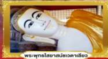
พระพุทธรูปไสยาสน์ชเวดาคาเสียว