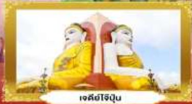
เจดีย์ไร้ฝุ่น