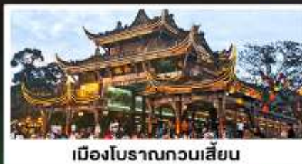
เมืองโบราณทวนเสียน