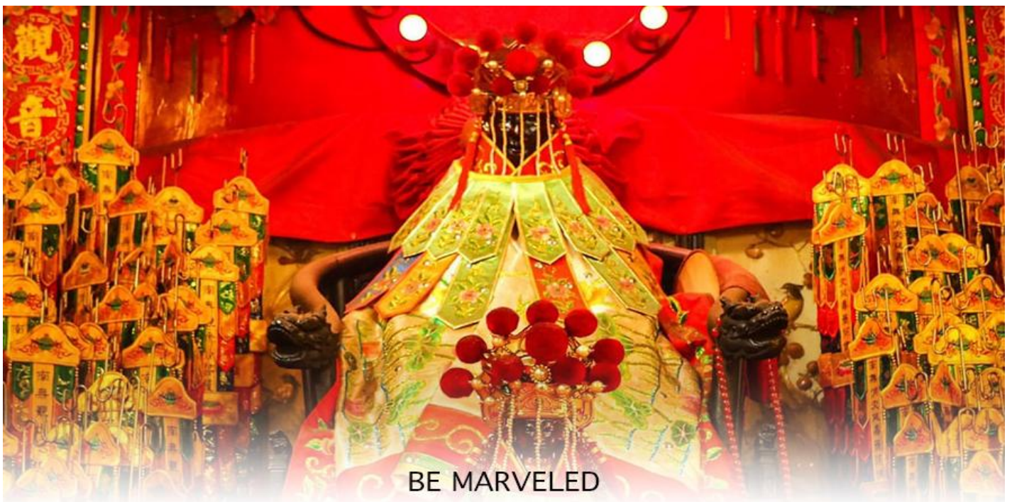
BE MARVELED วัดเจ้าแม่กวนอิมสองอำ (ยิมฮิน)

จากนั้นนำท่านสู่ เจ้าแม่กวนอิม วัดสองอำ (HUNG HOM KWUN YUM TEMPLE) เป็นหนึ่งในวัดที่เก่าแก่ที่สุดของฮ่องกง และชาวฮ่องกงเลื่อมใสศรัทธามาก สร้างขึ้นในปี ค.ศ.1873 ในสมัยช่วงสงครามโลกครั้งที่ 2 มีการปล่อยระเบิดลงบริเวณใกล้กับวัดแห่งนี้หลายต่อหลายครั้ง ทำให้มีผู้บาดเจ็บและล้มตายมากมาย แต่ชาวบ้านที่หนีเข้าไปหลบภัยในวัดนี้กลับปลอดภัยอย่างปาฏิหาริย์ และตัววัดก็ไม่ได้รับความเสียหายจากเหตุการณ์ที่ระเบิดอย่างน่าอัศจรรย์ ตามความเชื่อของคนจีนใน ฮ่องกง-มาเก๊า จะมี "วันเปิดทรัพย์" หรือ "พิธียืมเงิน เจ้าแม่กวนอิมฮ่องกง" เป็นวันที่จะมาขอพรและยืมเงินเจ้าแม่กวนอิม ซึ่งนับจากหลังวันตรุษจีน ไป 26 วัน จะเป็นวันเปิดทรัพย์ที่จัดขึ้นในทุกๆปี พิธีนี้จะมีเพียงครั้งปีละครั้งเท่านั้น เป็นวันสำคัญอีกวันที่คนหลังไหลมาไหว้ขอพรอย่างไม่ขาดสาย