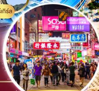
Shopping Tsim Sha Tsui