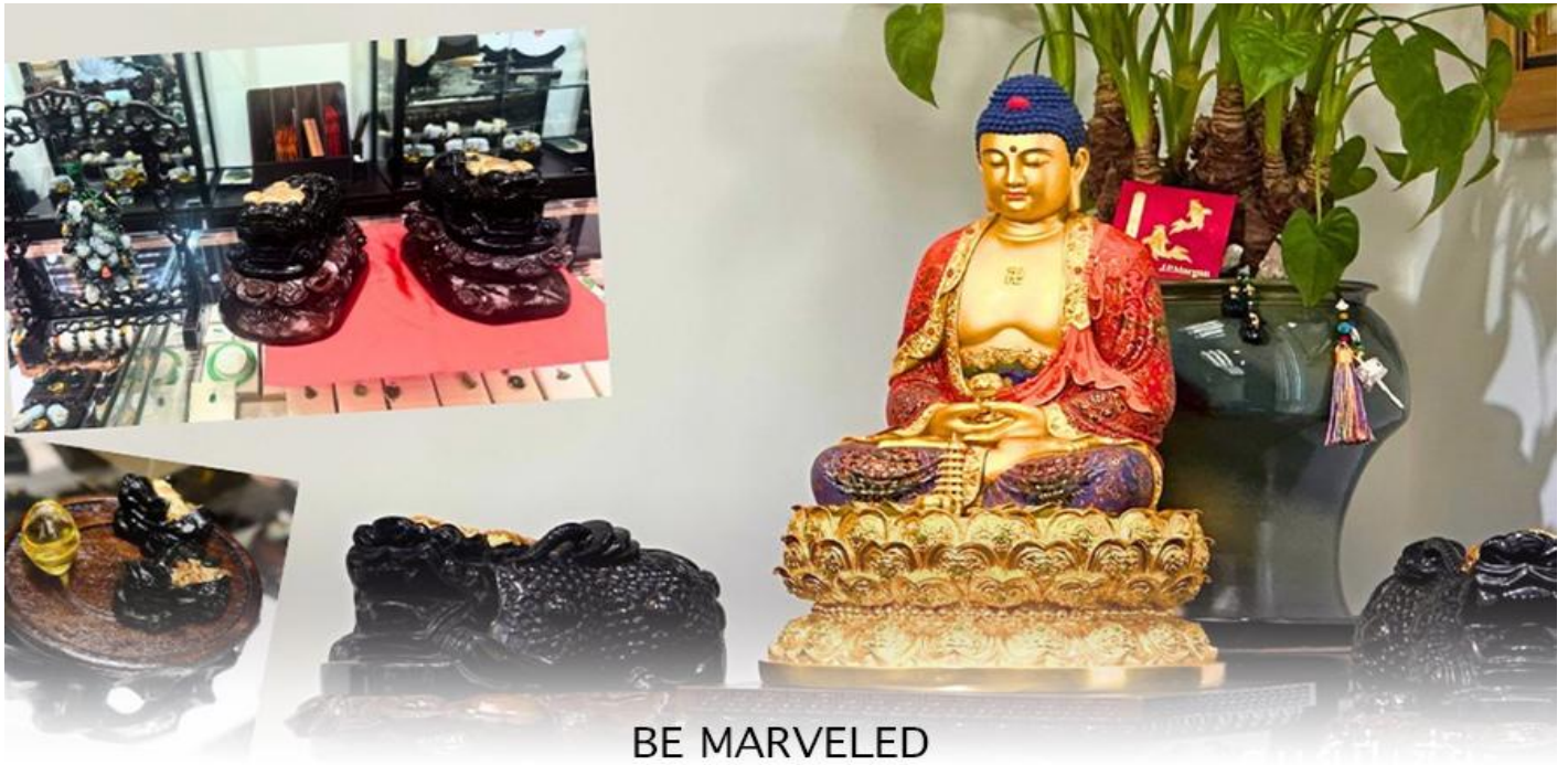
BE MARVELED ศูนย์บีเซี่ยะ

และนำท่าน ชม ศูนย์บีเซี่ยะ ซึ่งคนจีนนั้น ถือว่าหยกเป็นหิน ที่เป็นตัวแทนของความสวยงามและความบริสุทธิ์มีความเชื่อว่า หยก มงคล ถ้าพกติดตัวไว้จะอายุยืนและสุขภาพดีมีสินค้าน่ามากมายเกี่ยวกับหยก อาทิ กำไลหยก หรือสัตว์นำโชคอย่างบีเซี่ยะ ให้ ท่านได้เลือกซื้อเป็นของฝาก, ของที่ระลึก หรือของนำโชคแต่ตัวท่านเอง