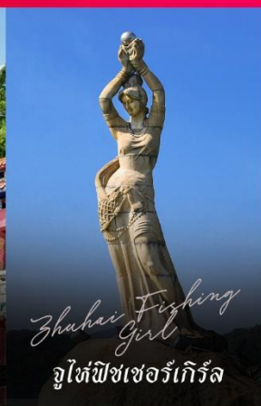
Zhuhai Fishing Girl จูไห่ฟิชเชอร์เก็ท