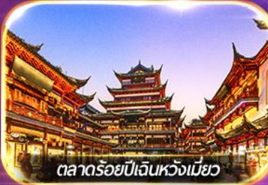
ตลาดร้อยปีเงินหวงเมี่ยว