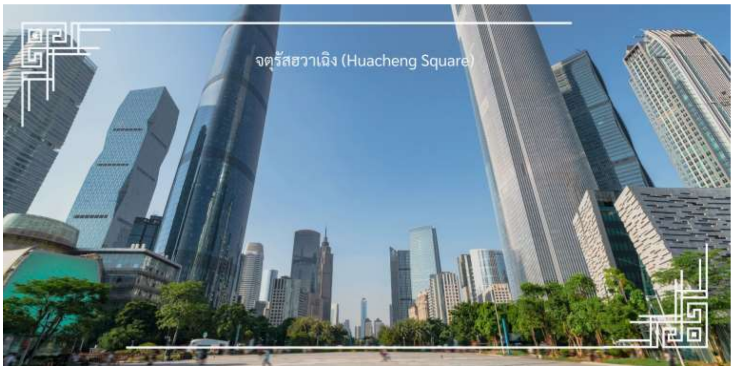
จตุรัสฮวาเฉิง (Huacheng Square)

ท่านชม จตุรัสฮวาเฉิง (Huacheng Square) หรือที่มีความหมายว่า “จัตุรัสดอกไม้” แลนด์มาร์กสำคัญใจกลางเมือง กวางโจว ที่ผสมผสานความรื่นรมย์ของธรรมชาติเข้ากับความทันสมัยของเมืองได้อย่างลงตัว บรรยากาศโดยรอบมีความร่ม