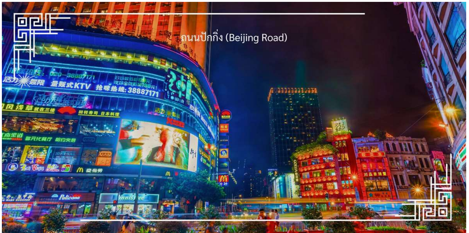
ถนนปักกิ่ง (Beijing Road)

สมควรแก่เวลา นำท่านอิสระกับการช้อปปิ้งที่ ถนนปักกิ่ง (Beijing Road) ที่นี่คือแหล่งช้อปปิ้งยอดนิยมใจกลางเมือง กวางโจว ที่คึกคักไปด้วยสีสันและบรรยากาศที่มีชีวิตชีวา สองฝั่งถนนเรียงรายไปด้วยร้านค้าแบรนด์ดัง สินค้าแฟชั่น เครื่องสำอาง ร้านอาหาร และของฝากของที่ระลึกมากมาย จุดเด่นที่ไม่เหมือนใครของถนนสายนี้ คือ โบราณสถานใต้ กระจก ที่เผยให้เห็นซากถนนในยุคราชวงศ์โบราณซ่อนอยู่ใต้ถนนปัจจุบัน ทำให้การเดินทางช้อปปิ้งที่นี่ไม่ใช่แค่เรื่องของสินค้า แต่ยังเป็นการสัมผัสประวัติศาสตร์ที่ซ่อนอยู่ใต้ฝ่าเท้าอย่างน่าสนใจ