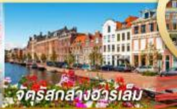
จัตุรัสกลางฮาร์เลม