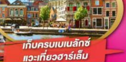
เก็บครบเบเนลักซ์ แวะเที่ยวฮาร์เลม