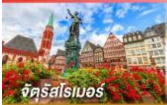
จัตุรัสโรเมอร์