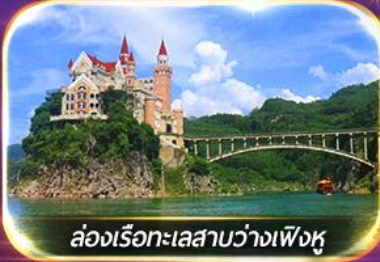
ล่องเรือทะเลสาบว่างเฟิงหู