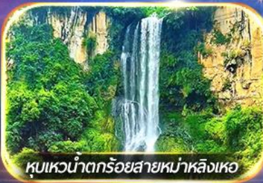
หุบเขาน้ำตกกรวยสายหม่าหลิงเหอ