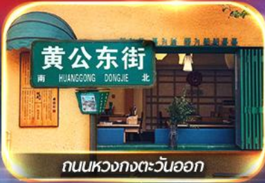
ถนนหวงกงตะวันออก