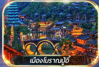
เมืองโบราณปู้จี้

สัมผัสบรรยากาศสุดโรแมนติก ณ หมู่บ้านปู้จี้ & ป่าภูเขาหมื่นยอด เดินเล่น Wenlin Street ชมต้นแปะก๊วย & ถนนสายคาเฟ่สุดฮิต