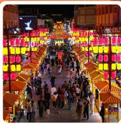
ตลาดกลางคีนซาโจว