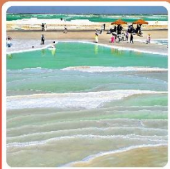
ทะเลสาบเกลือจาเอ้อหนาน

ไฮไลท์! กำมั่วเกาตุ กำพุทศศิลป์โบราณ มรดกโลก UNESCO ภูเขาสายรุ้งจางเย่ ภูเขาหินสีสั่นแปลกตา หนึ่งในภูมิประเทศที่แปลกที่สุดในโลก